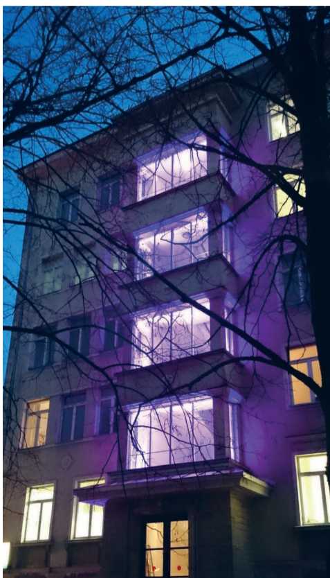
Illumineeritud ITK naistekliiniku fassaad

Täna firmat Wellmark Health, kes koordineerib selle päevaga seotud sündmusi üle Eesti, ning firmat CuuClub, kes tegi võimaliku illuminatsiooni, millega andsime enneaegsete peredele ja kogu ühiskonnale märku, et hoolime ja mõtleme.