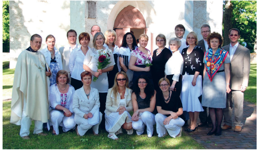
ITK segakoori koosseis

„Naiskoori me sugugi ei tahtnud, sest on olemas reaalne oht, et see võib kõlada nagu kassikontsert. Kui mõni mees ka kaasa joriseb, siis on hoopis teine lugu. Rääkimata